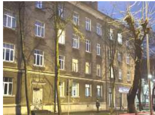
Dzīvojamā māja Imantas ielā 18