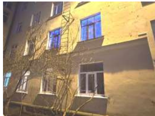
Dzīvokļa Nr.14 logi uz pagalma pusi