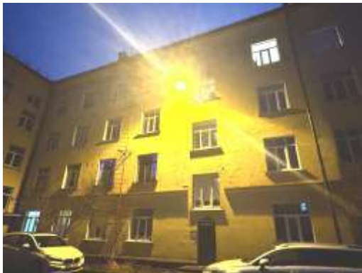
Dzīvojamā māja Imantas ielā 18