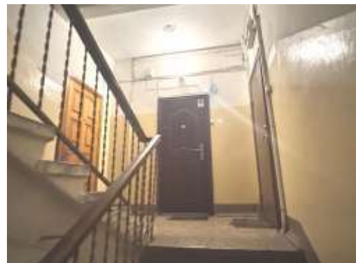
2.stāva kāpņu telpa