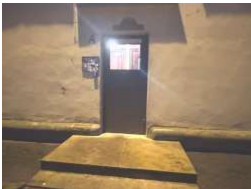
Ieeja kāpņu telpā