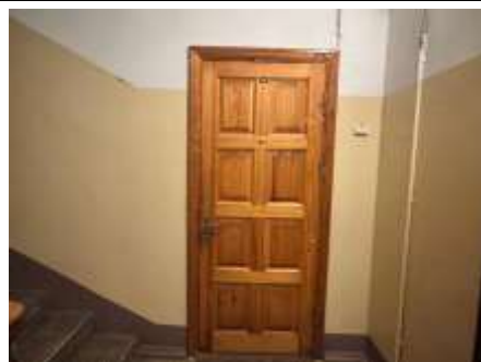
Dzīvokļa Nr.14 ieejas durvis